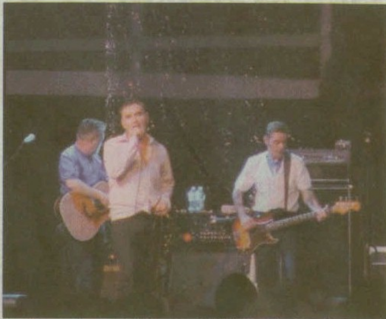
Morrissey durante il concerto di lunedì

Adesso però è il momento di pensare agli ultimi due grossi appuntamenti del Festival: mercoledì 26 luglio Yann Tiersen e Giovanni Allevi, un duo che propone qualcosa di nuovo, un concerto fortemente atteso. Yann Tiersen è ormai un affermato compositore che ama spiazzare il pubblico cambiando in continuazione. Nel suo ultimo album, dal titolo "Les Retrouvailles" è stato registrato in Bretagna, sull'isola di Ouessant, e risente di quest'atmosfera un pò malinconica: i brani delineano dei veri e propri paesaggi sonori. Dal vivo Yann utilizza strumenti insoliti e curiosi, come chitar-