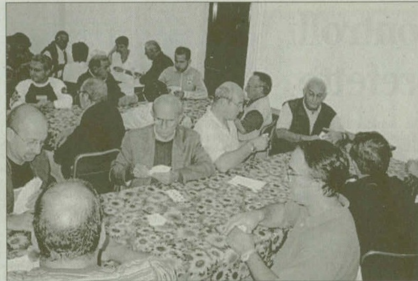
■ La prima serata della "Birimba" promossa da Vivere Castellazzo nei locali che furono della scuola elementare

Intanto la "Casetta delle Groane" già ospita la "Birimbata 2006", organizzata dall'associazione Vivere Castellazzo in collaborazione con il