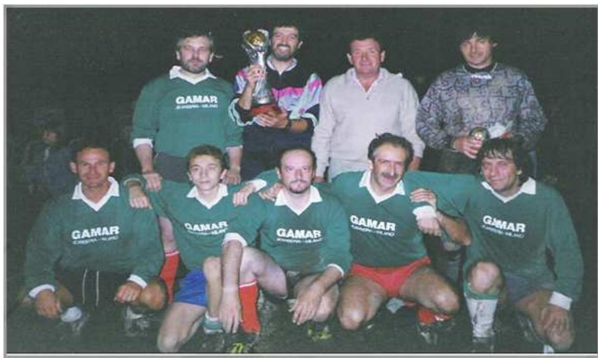
La formazione del REAL VILLETTE, vincitori dell'edizione del 1997