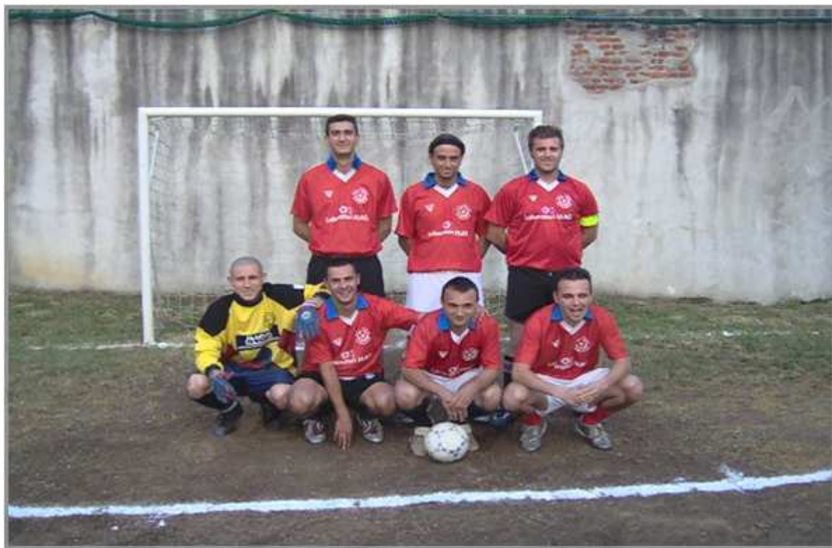
La formazione del RELAX BAR vincitrice dell' edizione 2005