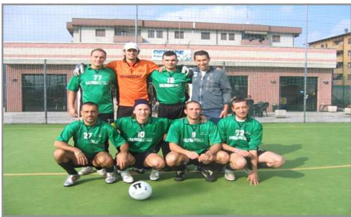
La formazione della S.S. THERMOS, classificatasi seconda nella passata edizione.

www.castellazzo.net - bollate.forumfree.net